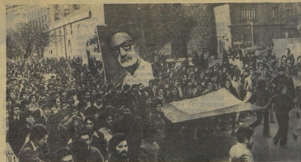
(Продолжение. Начало см. 1-ю стр.)

— МЫ ПРИЛЕТЕЛИ в Сантьяго в начале июля, через несколько дней после полета в осенний переворот. Действовал командный час. Столица, вся страна жили в тревожном напряжении. О прорисовках мы узнали из рассказов чилийцев: из газетных репортажей, увидели своими глазами следы пуга и снарядов на стенах зданий. Был флирт президентского дворца «Ла Монедра» был испещрен такими следами.